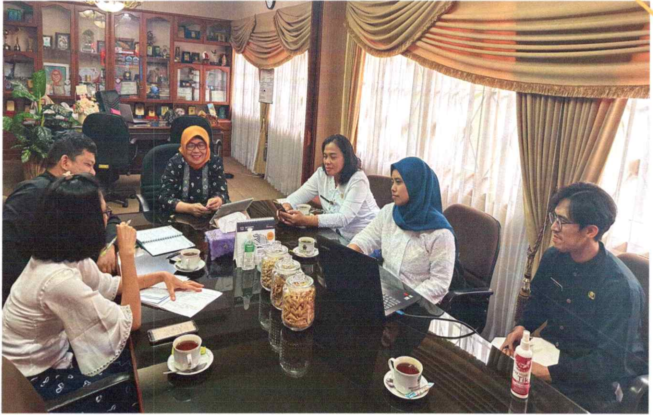
Kegiatan PPIDay's di Gedung Menara Wijaya Kabupaten Sukoharjo Tanggal 14 November 2024